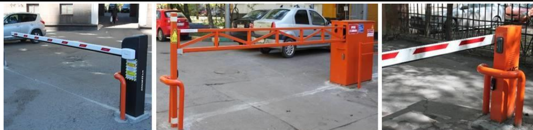
Фото 1 - ул. Дубровская 18 - шлагбаум Doorhan Barrier с защитой и Диспетчеризацией Фото 2 - ул. Зеленодольская д.7 - Антивандальный шлагбаум сварной с защитой и Диспетчеризацией Фото 3 - Семеновская наб. д.3 - шлагбаум FAAC 615 с защитой тумбы и Диспетчеризацией Еще больше примеров и карта наших работ на сайте www.proshlagbaum.ru